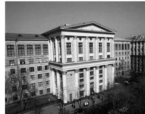
Российский государственный гуманитарный университет (Москва), костромской филиал которого можно назвать правопреемником первого вуза нашего города

Когда специалисты-преподаватели из Москвы, Ленинграда и Киева как один отказались переезжать в Кострому, «поступило указание сверху о том, что КТИ должен укрепиться, встав на ноги самостоятельно».