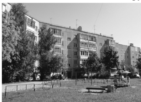
Дом 57 по улице Индустриальной

В начале июня наша газета рассказывала о том, как жильцы дома № 57 по улице Индустриальной во главе со старшей по дому Галиной Петровой после многомесячной переписки с властями и хождения по инстанциям сумели добиться включения своей многоэтажки в программу по капремонту жилья. На сегодня главная проблема дома – текущая крыша. На её ремонт целевым назначением выделили 2,5 миллиона рублей.