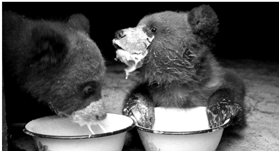
Миша и Маша, слегка повзрослев, научились есть из миски

На станции, где тогда уже жил медведь по кличке Ёжик, держать их возможности не было: малышей надлежало кормить молочными смесями каждые три часа, невзирая на время суток. Но не обрекать же было их на голодную смерть. Так они оказались в квартире начальни-