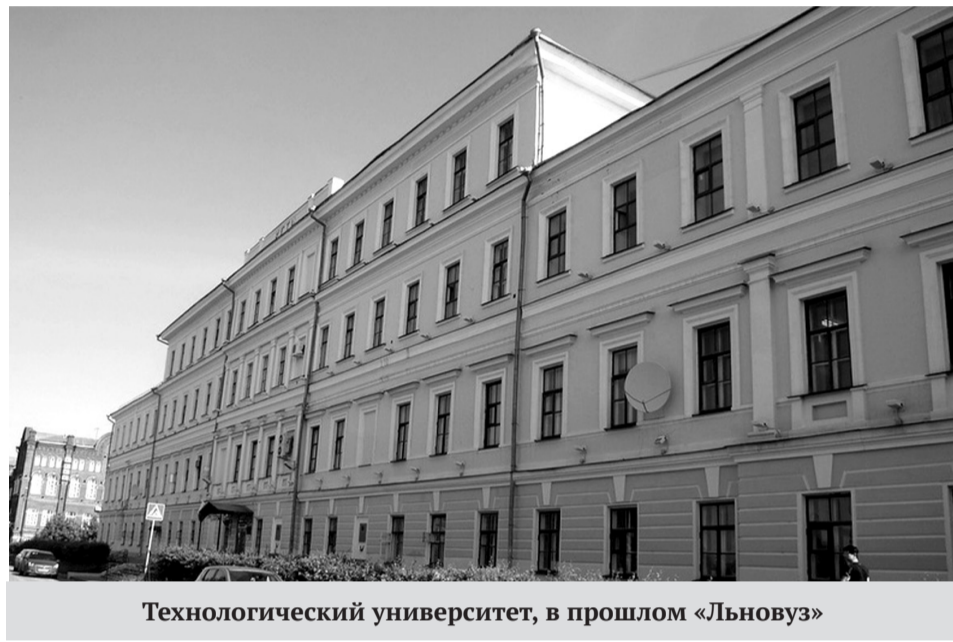
Технологический университет, в прошлом «Льновуз»

Почему преемником первого костромского вуза можно считать местный филиал РГГУ?