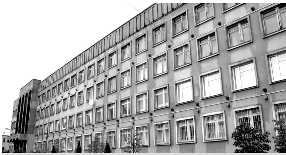
КГУ им. Н.А. Некрасова, в прошлом - пединститут